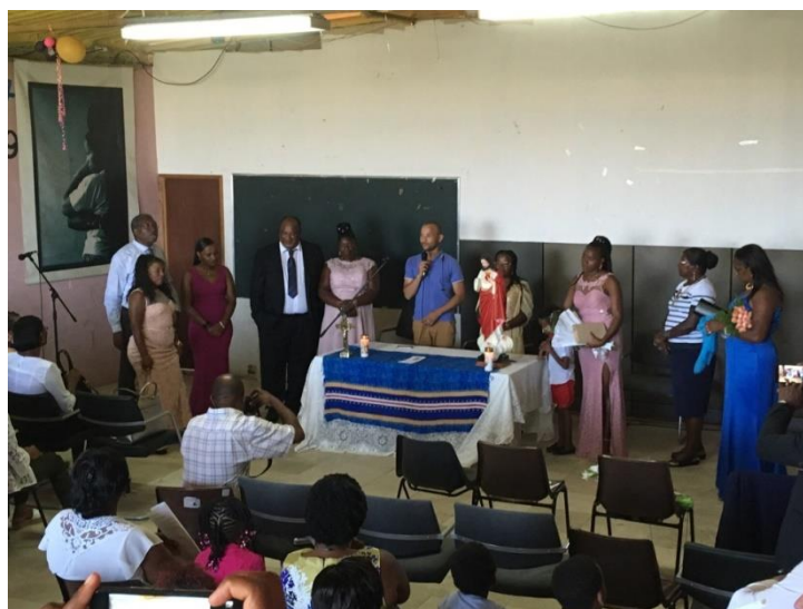
Figura 4 – 26.º Aniversário AMRT

A AMRT celebrou juntamente com a comunidade a Festa Sagrado Coração Jesus, Santo Padroeiro do Bairro do Talude e, a celebração do 26.º Aniversário da AMRT, no dia 8 de setembro, na sede.