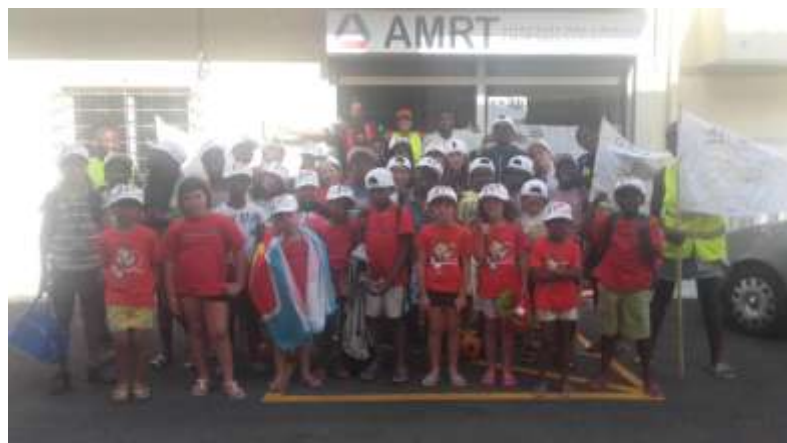
Figura 12 – Grupo UBUNTU SUMMER CAMP 2018

Ficou a vontade de voltar para ano, pois o campo de férias de verão já se tornou uma referência na freguesia e a procura por parte dos encarregados de educação tem vindo a aumentar, prova disso é a extensa lista de inscrições que faz com que algumas crianças, infelizmente, tenham que ficar de fora.