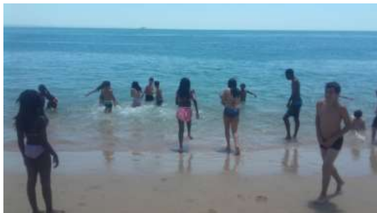
Figura 9 – Praia de Santo Amaro de Oeiras