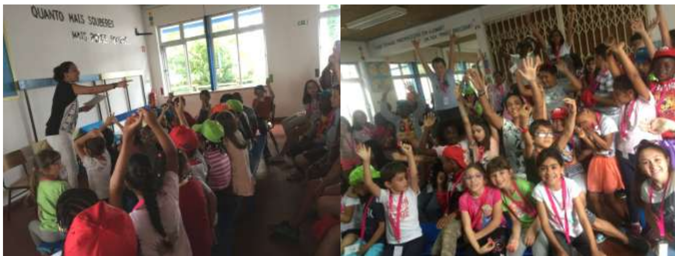
Figura 14, 15 e 16 – Workshop Literacia Financeira para crianças