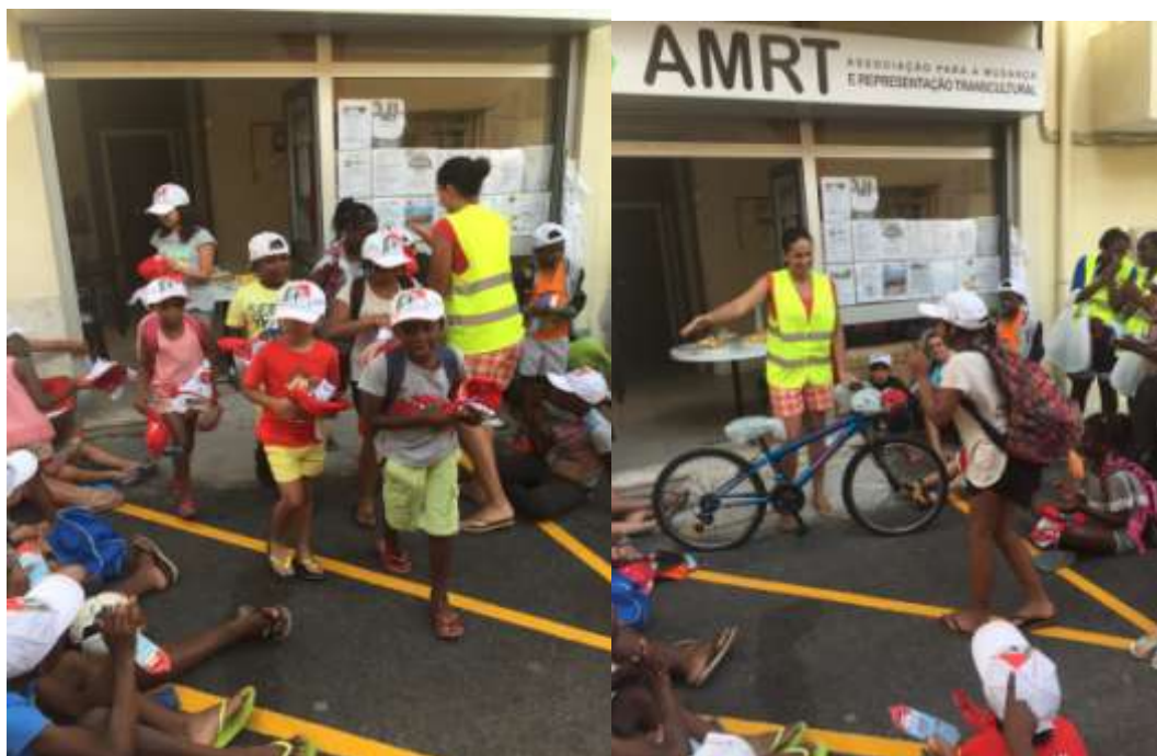
Figura 10 e 11 – Festa de Encerramento

O encerramento do campo férias ocorreu com uma festa/lanche convívio onde foram entregues algumas lembranças de participação, bem como o prémio Jovem atleta AMRT UBUNTU BASKET.