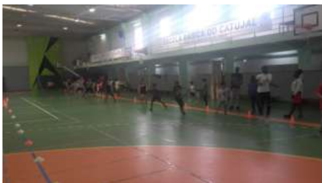
Figura 4 – Dinâmicas e jogos

Ao longo da semana, as crianças e adolescentes, estiveram envolvidas em diferentes atividades desportivas e lúdicas, nomeadamente: jogos tradicionais, visitas culturais, parque aquático e praia.