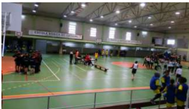
Figura 17 – Torneio na EB23 Alto Moinho – desporto escolar (Março 2018)

A equipa participou em vários eventos desportivos, nomeadamente, nos convívios organizados pela Associação de Basquetebol de Lisboa (ABL), torneios no âmbito do desporto escolar a convite da escola EB23 Alto do Moinho, Campos de férias a convite do Odisseia Basket Clube e outras atividades enquadradas no nosso plano de atividades.