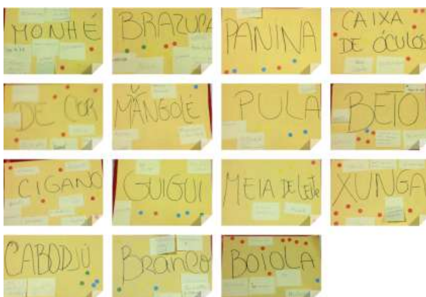
Figura 13 – Palavras e significados

No presente ano foram desenvolvidas algumas ações de sensibilização direcionadas aos/às utentes, voluntários/as e colaboradores/as da associação. No âmbito do projeto Despertar Consciências, são realizadas diversas dinâmicas, de modo, a mexer com preconceitos instalados e a desconstruir muros.