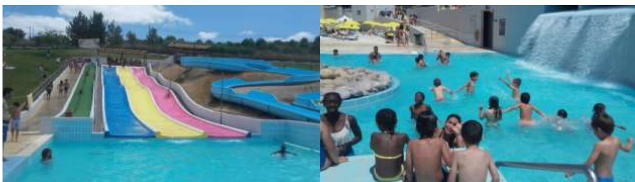
Figura 7 e 8 – Parque Aquático de Santarém