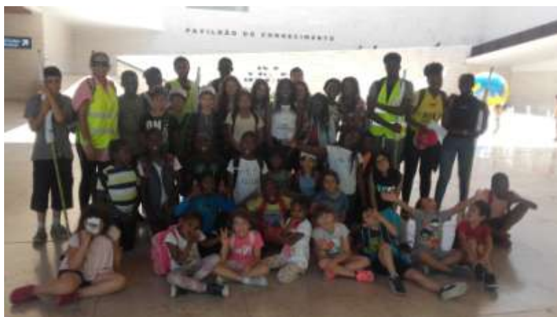
Figura 6 – Visita ao Pavilhão do Conhecimento