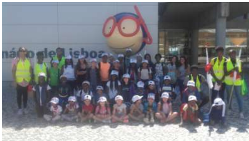
Figura 5 – Visita ao Oceanário