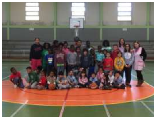
Figura 19 – Março Jovem – Campo de Férias da Páscoa

Realizamos, no âmbito do Mês da Juventude, um campo de Férias da Páscoa, onde convidamos uma Instituição da nossa freguesia (O Jardim de Infância AZUL & ROSA) a participar na nossa atividade intitulada de BABY BASKET, onde as crianças mais novas tiveram a oportunidade de estar em contato com a modalidade basquetebol.