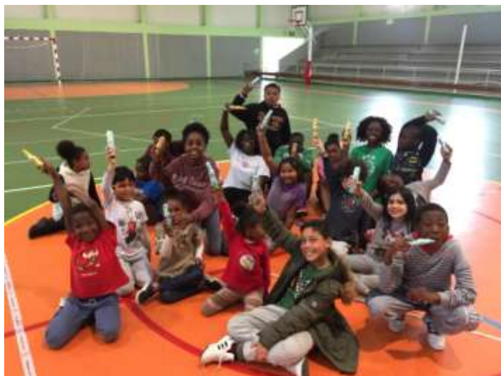
Figura 20 – Caça ao Coelho – Campo Férias Páscoa (Março 2018)

E como não podia deixar de acontecer, houve lugar à caça ao ovo, mas como a AMRT UBUNTU BASKET, é inovadora por natureza, os ovos foram substituídos por coelhos.